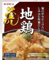
1969年 レトルト食品 「釜めしの素」発売