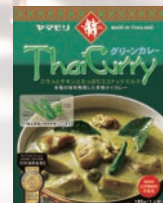
2000年 タイカレー発売 タイフード市場開拓