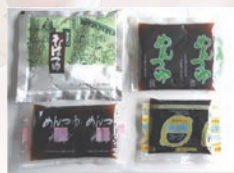
1967年 日本初液体小袋製品発売